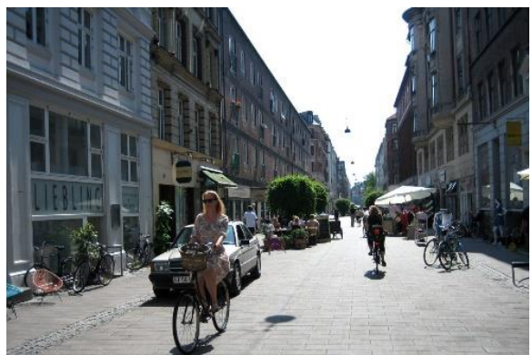
ZKLIDNĚNÉ ULICE V BLOKOVÉ ZÁSTAVBĚ