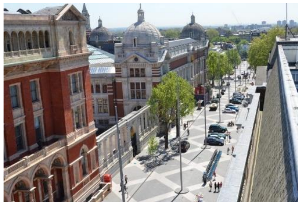
VÝZNAMNÉ MĚSTSKÉ TŘIDY A OBCHODNÍ ULICE