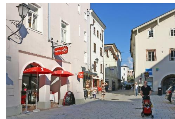
NÁMĚSTÍ ČI ÚZKÉ ULICE V CENTRU (MALÉHO) MĚSTA / NÁVES OBCE