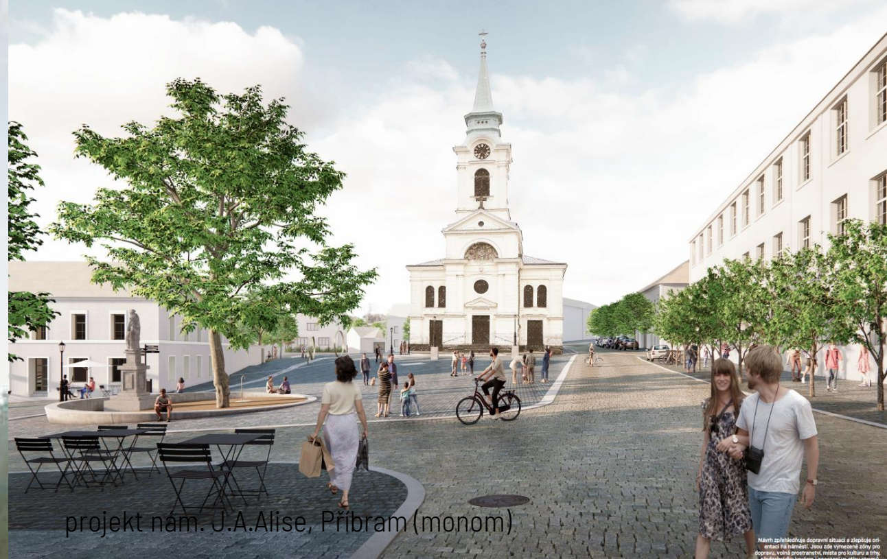
projekt nám. J.A.Alise, Příbram (monom)

Naměstí zohledňuje dopravní situaci a zlepšuje orientaci ve městě. Jeho záměrem je vytvořit zónu pro dopravu, volně prostranné místo pro kulturu a hry, které bude sloužit i jako místo pro setkávání.