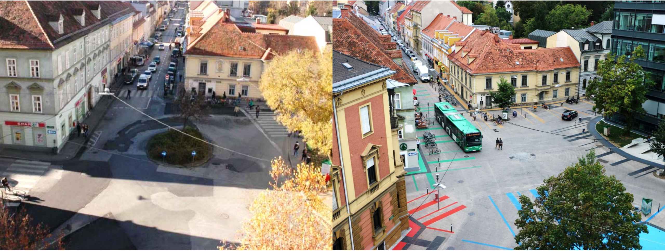
Sonnenfelsplatz, Gráz, Rakousko