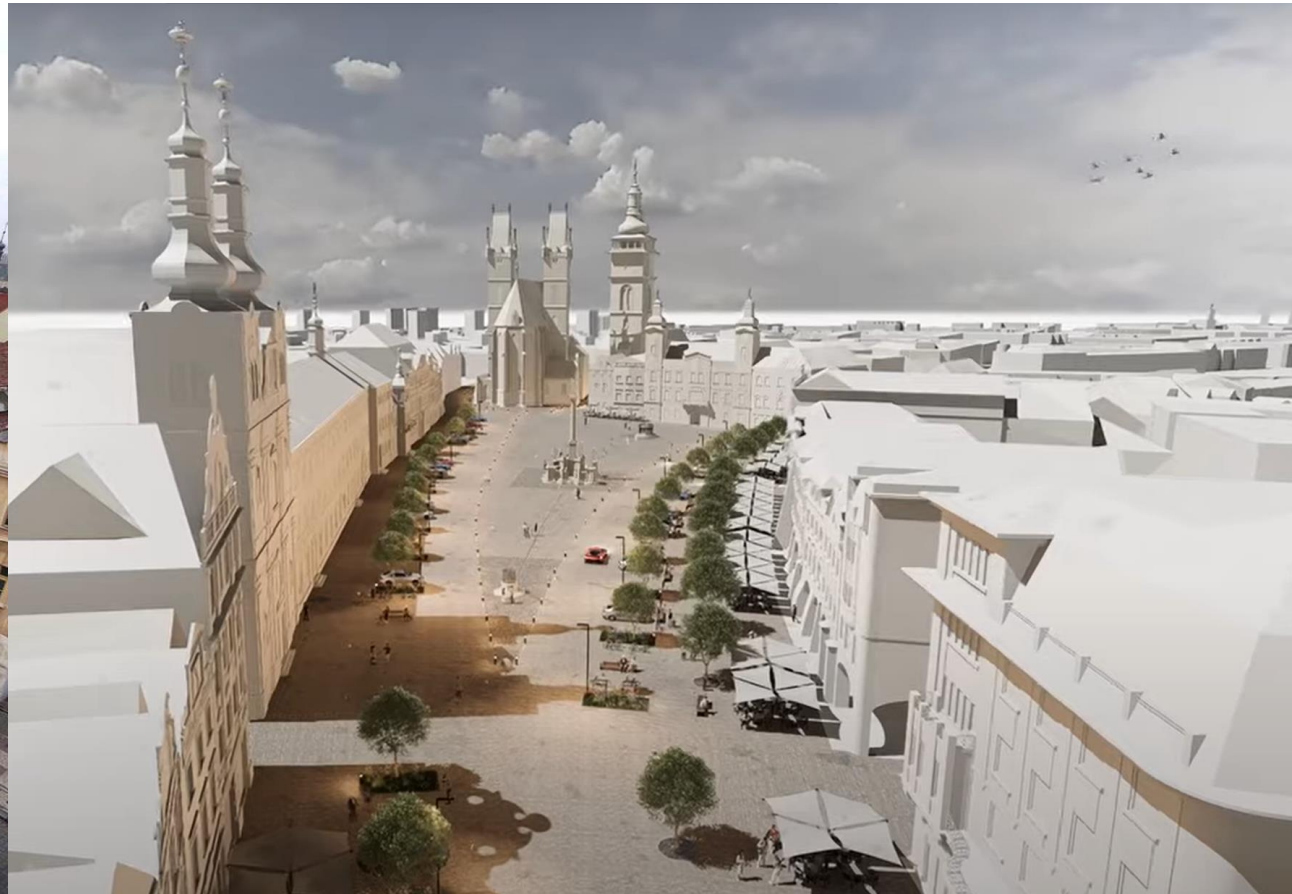
Velké náměstí v Hradci Králové (návrh Chmelík architekti + A R N s t u d i o)