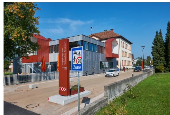
LOKÁLNÍ ULICE SE ŠKOLNÍM KAMPUSEM, S MALÝM OBCHODNÍM CENTREM ČI JINÝMI VÝZNAMNÝMI CÍLY