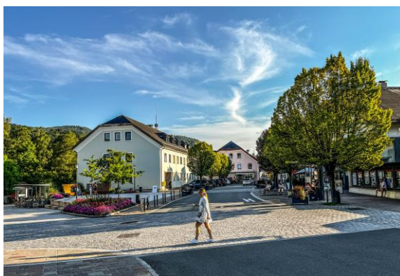
VÝZNAMNÁ VEŘEJNÁ PROSTRANSTVÍ, NÁMĚSTÍ A NÁVSI