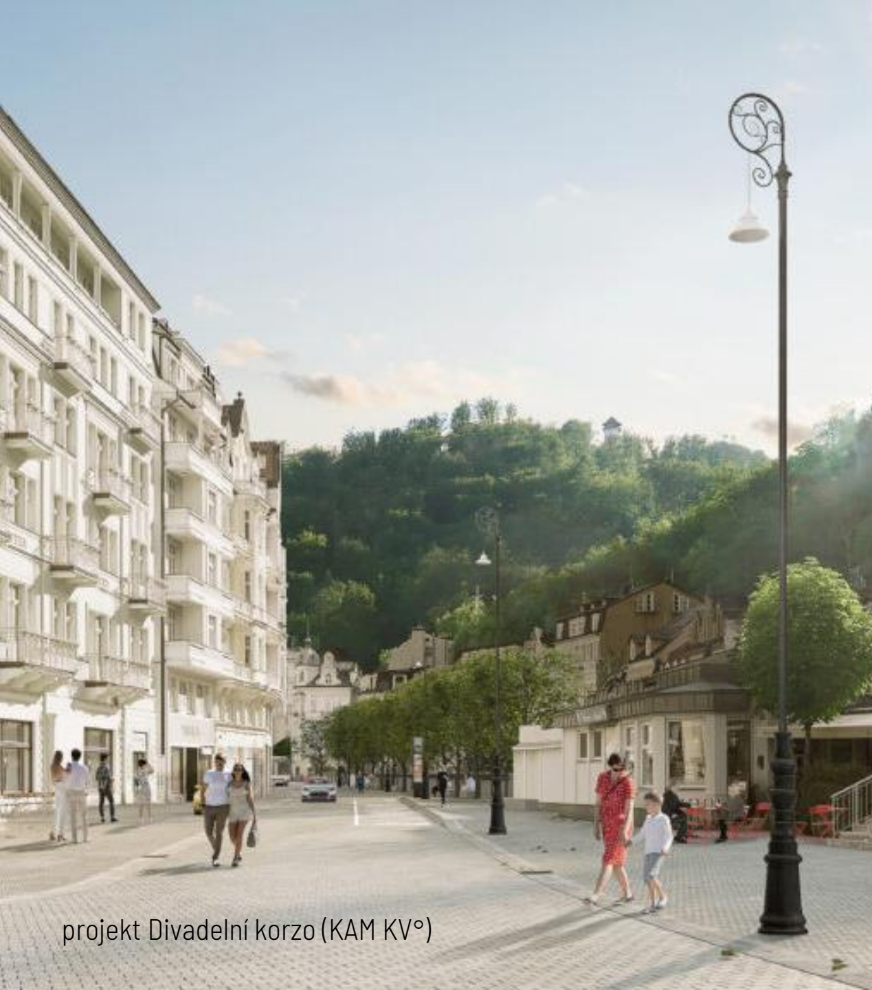
projekt Divadelní korzo (KAM KV°)