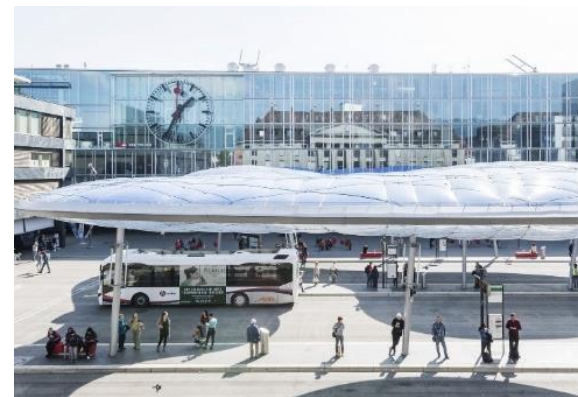
PLOCHY PŘESTUPNÍCH BODŮ VEŘEJNÉ DOPRAVY A PŘEDNÁDRAŽNÍ PROSTORY