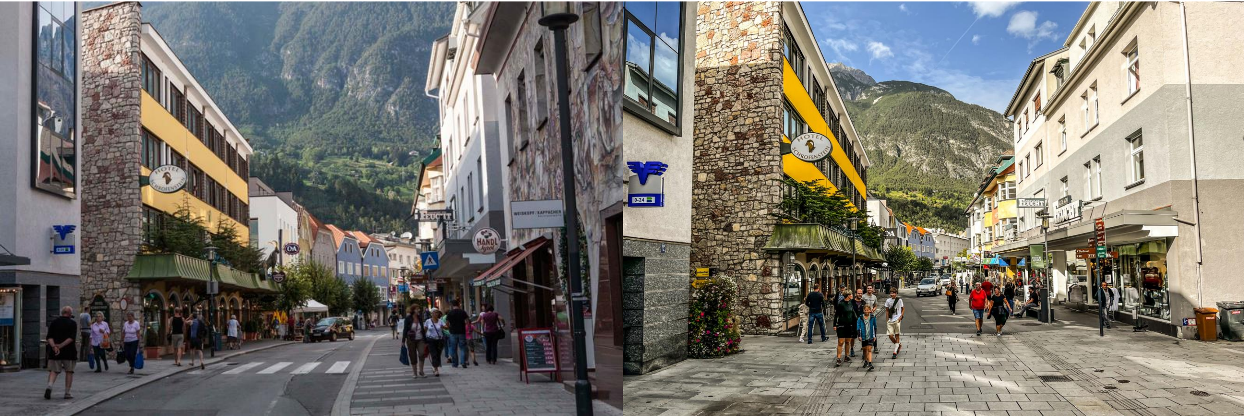
Malsersstraße, Landeck, Rakousko