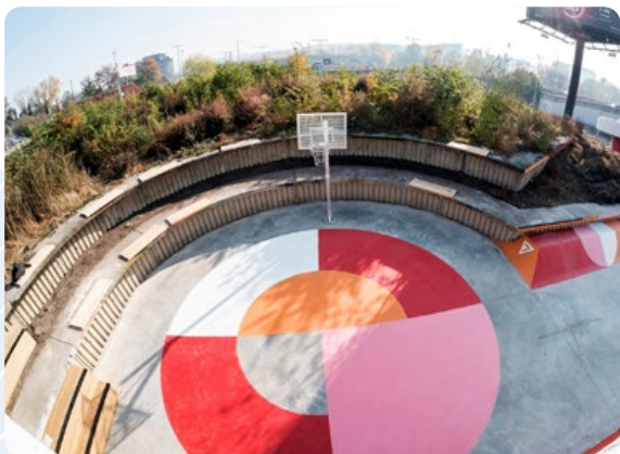
Oživení podchodů u stanice metra Vltavská Praha

Nad zanedbaným místem, kudy se lidé báli chodit, byly vybudovány nadzemní přechody , jimž lidé začali dávat přednost. Vznikla tak příležitost zbudovat v podchodech multifunkční prostory , které je možné využívat nejen pro pěší a cyklistickou dopravu, ale spíše k volnočasovým aktivitám a setkávání. I nadále však prostor slouží jako bezbariérový přístup ke stanici metra. Radnice nechala podchody proměnit na hřiště a park pro vyznavače aktivního způsobu života s překážkami pro skateboardisty a BMX bikery, lezeckou stěnou aj. Původně šedivý prostor byl oživen výraznými barvami a doplněn novým venkovním i vnitřním osvětlením . Další zatraktivnění přinese vybudování autobusového bistra se zázemím.