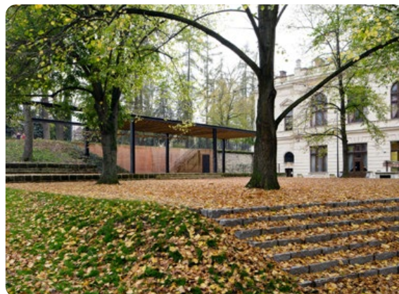
Obnova nábřeží řeky Loučné Litomyšl