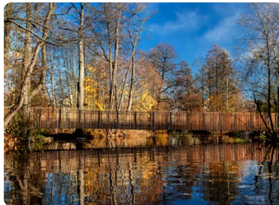
Lávka na Farských humnech Žďár nad Sázavou

Investor: Jihomoravský kraj, odbor regionálního rozvoje, s finanční podporou SFDI • Předkladatel do soutěže: Jihomoravský kraj • Autorský tým: PK OSSENDORF s.r.o., Ing. J. Nykodým, Ing. J. Otmar LL.M., MBA • Realizace: 30. 6. 2021