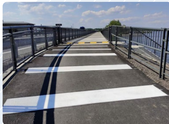
Bezpečná stezka pro cyklisty a pěší Nové Mlýny Jihomoravský kraj / 4.-5. místo

Investor a předkladatel do soutěže: Město Hodonín • Autorský tým: DUR: PP projekt Hodonín s.r.o. • Realizace: únor 2022