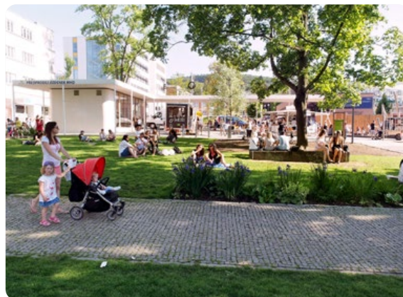
Park Komenského Zlín

Investor stavebního díla a předkladatel do soutěže: Městská část Praha 14 • Autorský tým: Prostora architekti + 23studio, Ing. Jan Pustějovský, PhD • Realizace: červen 2021