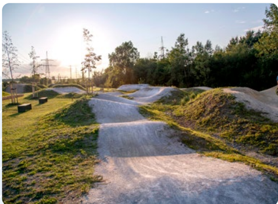
Bikepark Jahodnice Praha 14

Na zpuštěném místě navážek z blízké výstavby domů porostlých náletovými dřevinami vyrostl Bikepark Jahodnice sloužící převážně bikerům. Na své si zde přijdou ostřílení jezdci, začátečníci i děti, nové a upravené cesty lákají k příjemným procházkám. Unikátní sportoviště nabízí na 35 000 m 2 plochy pro rozvoj dovedností na kole, ale i dětské a workoutové hřiště a odpočinkovou zónu s občerstvením. Do parku se jezdci i pěši mohou dostat po cyklostezce, která jím prochází. Díky veřejnému osvětlení je možné park v zimě při dostatečném množství sněhu využívat i jako běžecký okruh. Kompletně revitalizovaný a nově osázený prostor je vhodný také pro pořádání veřejných akcí a setkání. Na realizaci parku se podílel i známý český biker Michal Maroši.