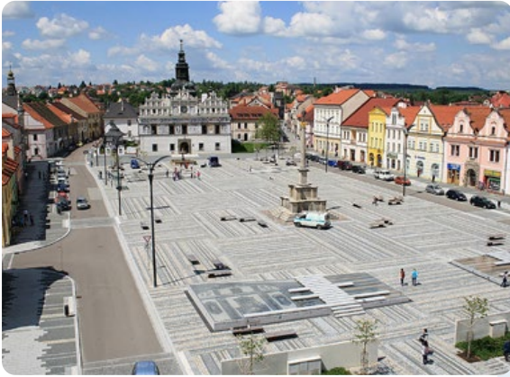
Obnova Masarykova náměstí Stříbro

Základním krokem revitalizace náměstí bylo vytvoření nového systému dopravní obslužnosti a průjezdnosti včetně řešení zpevněné plochy, vegetace a celkového uspořádání prostoru. Základní koncept náměstí vychází ze struktury historického centra města a zároveň se snaží splnit funkční nároky a požadavky současné doby. Zajímavostí je tzv. kilometrovník – kovový proužek v dlažbě, který vede po trase významné středověké evropské kupecké stezky, do něhož jsou vyryty názvy měst, kterými stezka procházela, včetně vzdáleností. Náměstí je nyní využíváno jako významný reprezentativní prostor centra města splňující požadavky na zklidnění a vytvoření odpočinkové plochy pro obyvatele a návštěvníky města.