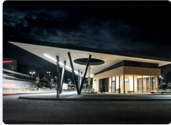
Autobusový terminál a bike+ride Nová Paka

Investor: Město Stříbro • Předkladatelé do soutěže: Markéta & Petr Veličkovi – M&P architekti – krajinářská architektura • Autorský tým: Markéta & Petr Veličkovi • Realizace: červen 2014, prosinec 2018