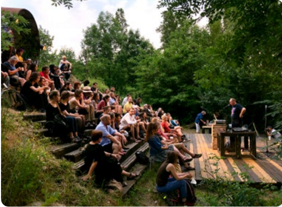
Přístav 18600 Praha

Přístav 18600 je komunitní projekt, který změnil opuštěné prostředí městské divočiny brownfieldu na obyvatelný Art park . Pozemek v majetku hlavního města Prahy, který byl dříve využíván jako seřadiště při vlakové stanici Karlín-Přístav a později pro různé dílenské provozy a jejich zázemí, se po povodni v r. 2002 proměnil v černou skládku. Od roku 2014 zde postupně vzniká živý park . Nově přístupná zeleň pro Karlín i širší okolí, která v letní sezóně ožívá kulturním či vzdělávacím programem a nabízí možnost sportovního využití i místa pro dětské radovánky. Svě útočiště v Přístavu našly mnohé iniciativy a setkávají se zde jak místní Karlíňané, pražští a mezinárodní umělci, tak i návštěvníci z celé Prahy.