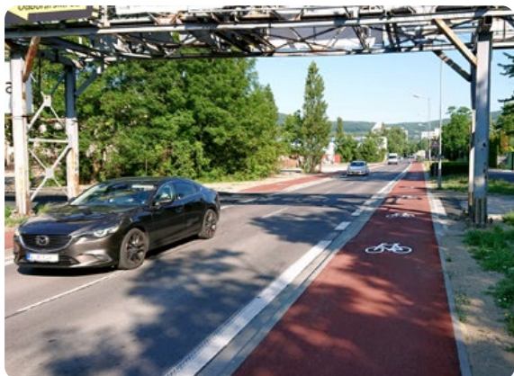
Cyklopruhy Odborárska Bratislava

Oddělená cyklistická komunikace podél Odborárskej ulice v Bratislavě zvyšuje bezpečnost a komfort cyklistů, a to spolu s bezpečným křížením s odbočující motorovou dopravou. Oddělení chodců od cyklistů a motoristické dopravy za zelený prostor s výsadbou zlepšuje podmínky pro pohyb chodců. Díky těmto opatřením a vyvýšenému stejnosměrnému cyklopruhu na obou stranách Odborárskej ulice jsou cyklisté odděleni od automobilové i pěší dopravy a infrastruktura se tak stává bezpečnější a plynulejší. Jízdní cyklistické pruhy jsou průběžné s předností v jízdě v celém řešeném úseku. Červený asfalt jasně odlišuje cyklistickou dopravu od ostatních druhů dopravy, chodník pro pěší byl vybaven novým asfaltovým povrchem.