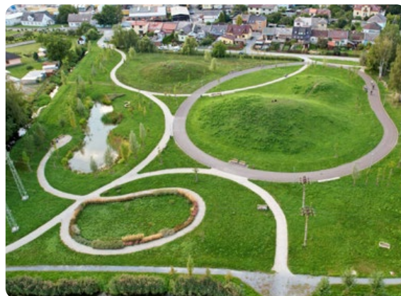
Knižecí sady Zábřeh / 3. místo

Investor a předkladatel do soutěže: Statutární město Most ● Autorský tým: (Fun park) UniPark s.r.o. ● Realizace: 2019–2020