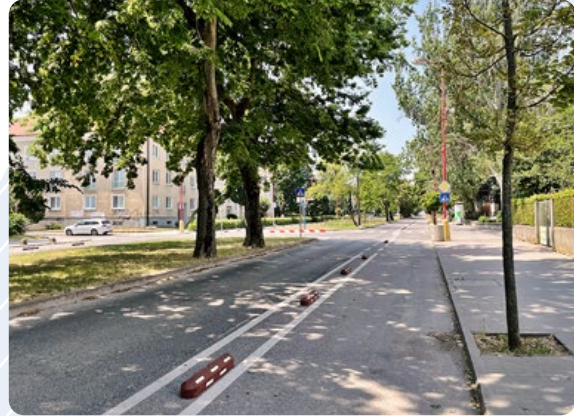
Cyklopruhy na Študentskej ulici Trnava