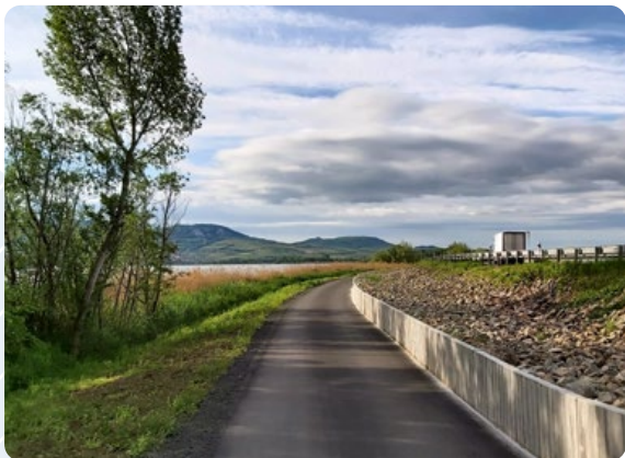
Bezpečná stezka pro cyklisty a pěší Nové Mlýny Jihomoravský kraj

Obousměrná společná stezka o šířce 3,5 m a délce 2,6 km s lávkou pro chodce a cyklisty zpříjemňuje fandům aktivní dopravy cestování v oblasti střední nádrže vodního díla Nové Mlýny na jižní Moravě a zajišťuje bezpečné spojení s cyklotrasou EuroVelo 9. Hlavní výhodou je oddělení bezmotorové dopravy od silničního tahu z Brna do Vídně. Ocelová lávka má betonový povrch, cyklostezka je asfaltová a je vybudována nejen s ohledem na bezpečnost cyklistů a chodců, ale i zvířat. Nalezneme na ní tři suché „propustky“ (tunely pod silnicí), umožňující zvířatům projít bezpečně z jedné nádrže na druhou a snížit jejich úmrtnost na silnici. K těmto propustkům jsou navedena pomocí 90 centimetrů vysoké migrační bariéry.