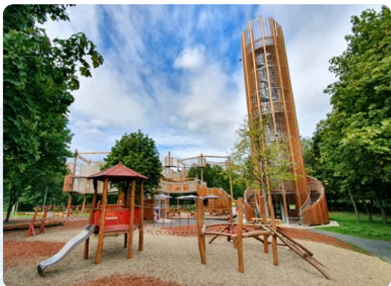
Šibeník – centrální park města Most / 2. místo

Park Šibeník byl od počátku budování nového Mostu koncipován jako centrální park města. Vznikla řada nových instalací, zejména FunPark s vyhlídkovou věží a 3D bludištěm – největším zařízením tohoto typu v České republice, street workout sportoviště , dětská hřiště , skatepark nebo parkourové hřiště . Současné vedení města pokračuje v práci svých předchůdců a chytrými změnami v parku vytváří atraktivní prostředí pro mladé aktivní rodiny. Celý park je protkaný šesti kilometry cest pro pěší i cyklisty včetně naučných stezek (například stezka válečných artefaktů). Cyklisté ocení možnost úschovných cykloboxů, které v sobě mají zabudované elektronabíječky.