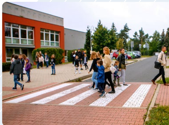
Školní ulice Říčany