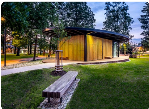
Obnova parku Stromovka Humpolec

Vytvořit městskou zahradu , která zachová co nejvíce zeleně uprostřed města, bylo cílem architektonické soutěže vypsané městem Humpolec na park Stromovka. Realizace přinesla citlivé změny do cenného území v centru města. Hranice parku vymezuje nízký živý plot, který odděluje novou pobytovou louku s altánem od přilehlých ulic. Parkem prochází několik cest z různých materiálů – méně důležité stezky jsou mlatové, hlavní kamenné. V parku se nachází dětské hřiště navržené speciálně pro toto místo. Nabízí prolézačky s lanovými sítěmi, tunely, pohyblivé boudičky, můstky a klouzačku. Centrem celého parku je altán se zelenou střechou, s kavárnou , terasou a veřejnými toaletami.