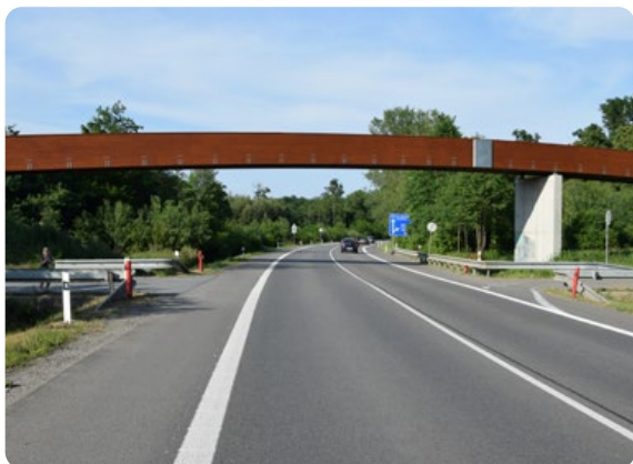
Lávka pro pěší a cyklisty u ZOO Hodonín / 4.-5. místo

Lávka pro pěší a cyklisty byla vybudována v místě nebezpečného křížení stezky se silnicí I/55 u ZOO, kde se v minulosti stalo několik tragických nehod. Místo je navíc velmi frekventované – kromě maminek s kočárky je výchozím bodem také pro sportovce a cyklisty směřující do Bojanovic nebo Mutěnic. Stavební práce byly zahájeny v září 2021 úpravou terénu včetně nezbytného kácení dřevin. Následovala výstavba opěr, středního pilíře a postupné budování náspů včetně prací na propustku. Poté byla osazena samotná nosná konstrukce dřevěné lávky. Závěrečná etapa spočívala v dodělání asfaltové stezky a na jaře se zde počítá ještě s výsadbou stromů a zeleně. Budoucnost lávky souvisí s plánovanou stavbou dálnice, jejíž termín zatím není znám.