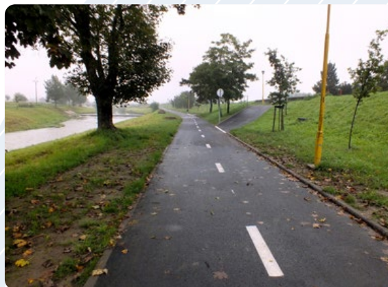
Stezka Otrokovice-Zlín Otrokovice