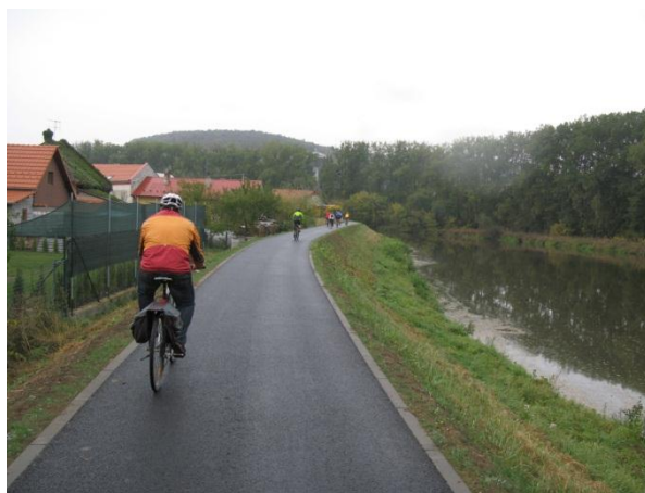
Napajedla – I. etapa