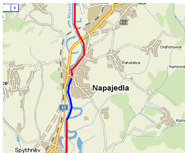
Mapa – Červený úsek